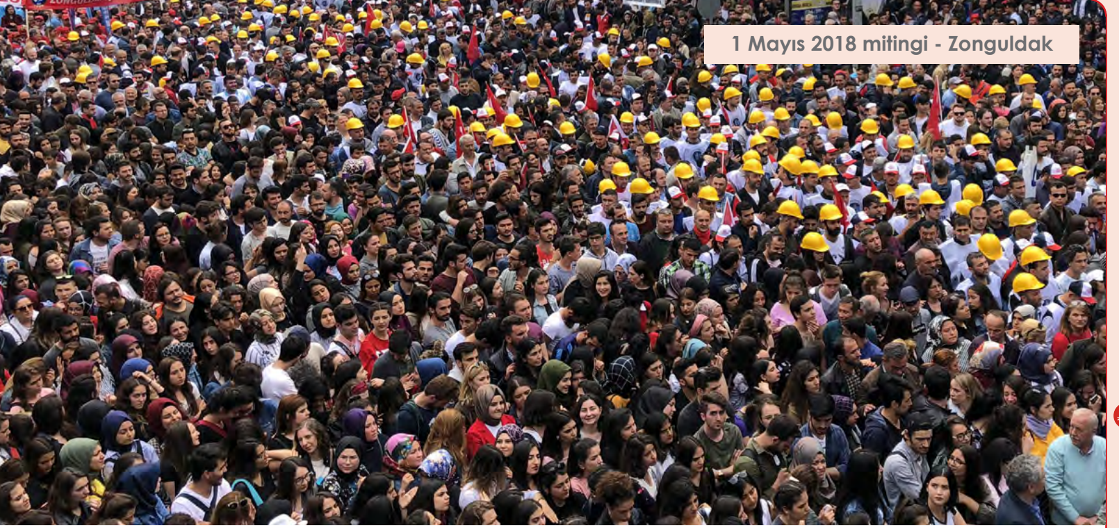
1 Mayıs 2018 mitingi - Zonguldak

Uluslararası İşçi Dayanışması Derneği Bülteni • 15 Temmuz 2018 • No: 124