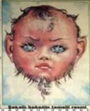
Sakallı bebeklerin aşkını yansıtan fotoğraf