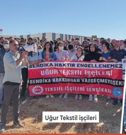
Uğur Tekstil işçileri