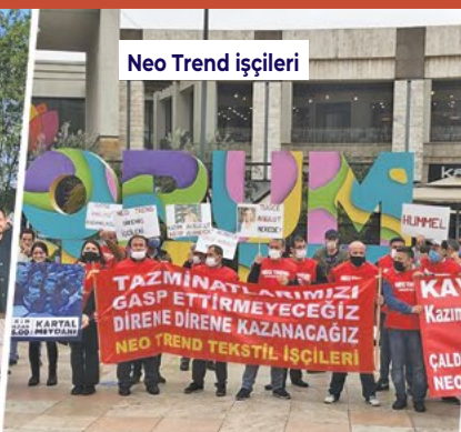
Neo Trend işçileri