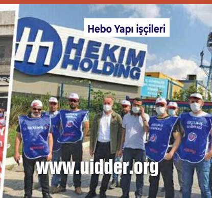
Hebo Yapı işçileri