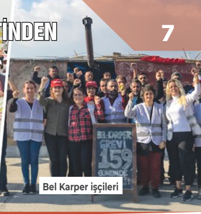
Bel Karper işçileri