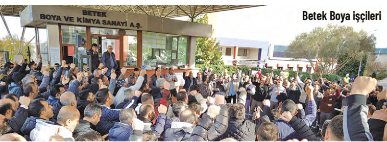
Betek Boya işçileri

Tekgıda-İş'in Bursa'da Eker Süt'te, Teksif Sendikasının İstanbul/Tuzla'da TKIS Blinds'de, Öz İplik-İş'in İstanbul/Silivri'de Yelkenci Tekstil'de başlattığı direnişler sürüyor. Hatay/Payas'ta Öz Çelik-İş'in örgütlü olduğu Yolbulan Metal'de, İzmir/Kemalpaşa'da Öz Gıda-İş'in örgütlü olduğu Abalioğlu Lezita'da, İstanbul/Tuzla'da Petrol-İş'in örgütlü olduğu Tarkett Turkey'de işçilerin grevleri devam ediyor. ■