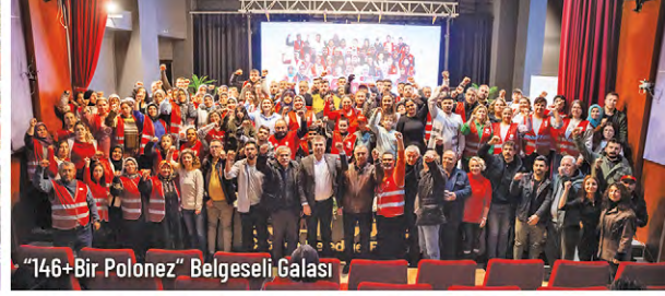
"146+Bir Polonez" Belgeseli Galası