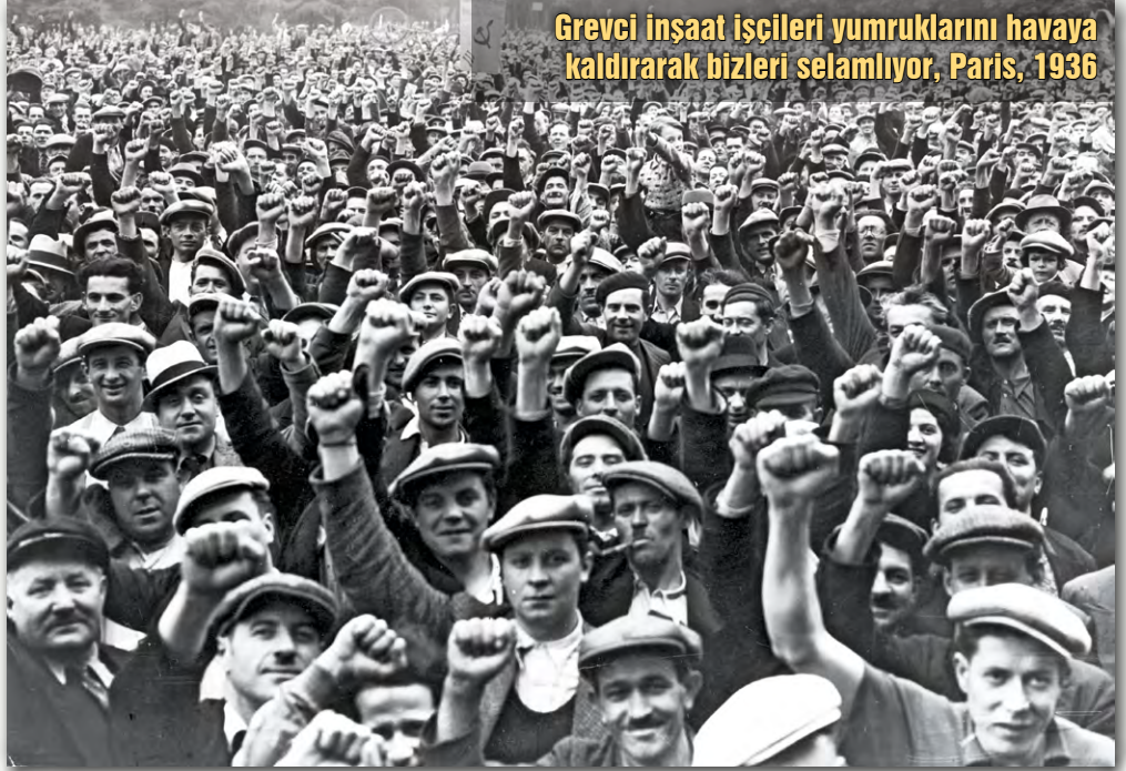
Grevci inşaat işçileri yumruklarını havaya kaldırarak bizleri selamlıyor, Paris, 1936

Bir emekçinin çeşitli çıkarlar sağlamak, haklar elde etmek ya da hak kayıplarını engellemek amacıyla işi durdurması, işgücünü kullanmaktan imtina etmesi esasında binlerce yıldır başvurulan bir yöntem. İş bırakma eylemi, esasında emeğin gerçek sahibinin sömürücü efendiye karşı mücadelesinde keşfettiği bir mücadele aracı olarak doğmuş, Antik Çağdan Ortaçağ’a tekil sayılabilecek örneklerle tarih sahnesine çıkmıştır. Örneğin günümüzden yaklaşık 3200 yıl kadar önce, eski Mısır’da piramitlerin yapımı sırasında zanaatkârlara ücret olarak verilen yiyeceklerin dağıtılması gecikir. Aileleri açlıkla karşı karşıya kalan taş ve duvar ustaları eşlerinin de desteğiyle işi durdururlar. Tarihte tespit edilebilen ilk grev örneği budur. Bundan yaklaşık 300 yıl kadar önce gerçekleşen sanayi devrimiyle birlikte üretim sürecinde makineler devreye girdi, fabrikalar kuruldu, işçi sınıfı büyüyüp gelişti. Kapitalizm diye adlandırılan sistem, toplumu temelde iki sınıfa böldü: işçi sınıfı ve patronlar sınıfı! İş bırakma eylemlerinin sıklığı, büyüklüğü ve etkisi zamanla arttı. İşçi sınıfı sömürüye karşı aynı dili konuşmaya başladı: Grev!