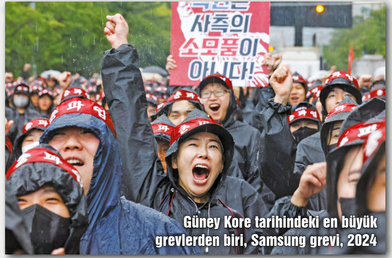
Güney Kore tarihindeki en büyük grevlerden biri, Samsung grevi, 2024

“Şalter İnecek, Bu İş Bitecek!” Bu slogan yaşadığımız topraklarda nice fabrika duvarında yankılanmış, nice işyeri önünü işçi sınıfının bayram alanına çevirmiştir. Ne anlatır peki bu slogan? Tüm toplumsal hayatın temelinde üretim vardır. Üretim olmadan, sayısız eşya ve sayısız hizmet üretilmeden hayat akmaz, durur. İşçi sınıfı sahip olduğu muazzam gücü önemli oranda buradan alır. Üretimi yapan eller şalterleri indirince, yani işçiler greve çıkınca özgüven kazanırlar. Yaşadıkları yalnızlık hissi daha grevin ilk günlerinde yok olmaya başlar. Üretimden gelen gücünü kullanan işçiler, birliklerinden, örgütlülüklerinden de güç alırlar. Artık tek tek işçiler yoktur, önünde hiçbir kudretin duramayacağı işçi sınıfı vardır, sınıf birliği vardır.