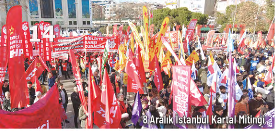
8 Aralık İstanbul Kartal Mitingi