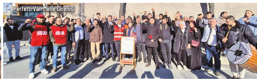
Perfetti Van Melle Direnişi