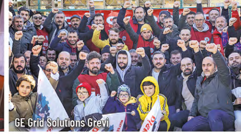
GE Grid Solutions Grevi