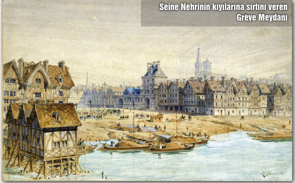
Seine Nehrinin kıyılarına sırtını veren Grève Meydanı

“Grev” kelimesi Fransızcadan dilimize girmiş. Bundan yüzyıllar önce Paris’te belediye binasının önünde bulunan, iş arayanların topluca beklediği, bir anlamda “amele pazarı” işlevi gören bir meydan vardır: Grève Meydanı! Bu meydanda iş için beklemek halk dilinde “grev yapmak, grevde olmak” şeklinde yer edinmiştir. Bu böyle sürüp giderken çalışma koşullarını protesto etmek, ücretlerini yükseltmek isteyen işçiler de Grève Meydanına çıkmaya başlamışlar. Böylelikle 19. yüzyılın ortalarından başlayarak grev kelimesi nihayet bugünkü anlamına kavuşmuş ve işçilerin hak elde etmek için toplu bir şekilde işi durdurması eylemini anlatır olmuş.