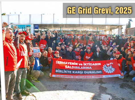
GE Grid Grevi, 2025

Dayanışma TV'nin hazırladığı “Grev Nedir, Ne Değildir, Neden Yasaklanıyor?” belgeselini izlemek için karekodu okutunuz.