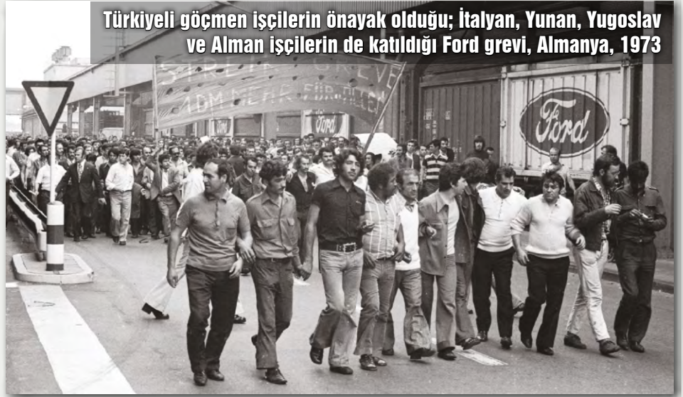
Türkiyeli göçmen işçilerin önyak olduğu; İtalyan, Yunan, Yugoslav ve Alman işçilerin de katıldığı Ford grevi, Almanya, 1973

Patronlar sınıfı ve işçi sınıfı arasında kimi zaman üstü örtük kimi zaman ise açıktan süregelen ve sınıf savaşı olarak adlandırılan mücadelenin küçük küçük cepheleridir grev alanları! Grev sınıfın sorunlarının ortak, mücadelesinin bir olduğunu ortaya çıkarır. Bu sebeple grev için yaşadığımız topraklarda “işçi sınıfının okuludur” denilir. Bu okul sınıf dayanışmasının hayati bir ihtiyaç olduğunu gösterir. Sınıf dayanışması, din, dil ve ırk ayrımı yapmadan hangi fabrika, sektör veya ülkede çalışıyor olursa olsun işçi sınıfının birliğinin ve yardımlaşmasının ifadesidir. Dünden bugüne işçi sınıfı, sınıf dayanışması içinde paylaşmanın, yardımlaşmanın, ortak mücadele etmenin en güzel örneklerini göstermiştir. Mesela 1986’da darbe yasaklarını büyük bir grevle yırtıp atan Netaş işçileri, daha sonra greve çıkan Derby işçilerine kendileri için toplanan parayı ve ayrıca grev çadırlarını teslim etmiştir. Grev çadırı, yağmurdan ve soğuktan koruyan bir muşambadan çok fazlasıdır çünkü. O çadır işçiler için onur demektir, sınıfın mücadelesi ve zaferi demektir.