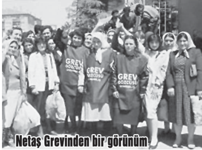
Netaş Grevinden bir görünüm

Dört işçiden fazla grev gözcüsü bulunamaz yasağına karşın, her gün 163 grev gözcüsü fabrika önünde bekliyordu. 500 işçi aktif bir biçimde görev alıyor ve grevin günlük işlerini gerçekleştiriyordu. Grev boyunca tek bir işçi bile başka bir işte çalışmamıştı ve "kendi dayanışma işlerimizde çalışırız, dayanışmamızı kendimiz örgütleriz" demişlerdi. Grev boyunca aileleri de grev alanından ayrılmıyordu. Netaş grevcileri, bir işyerinde işçiler ne kadar örgütlü olurlarsa olsunlar bunun yeterli olmayacağını anlamışlardı. Grevin duyurulması ve yayılması için çevre fabrikalara, mahallelere, ailelere ve gençliğe giderek sınıf dayanışmasını örmeyi ba-