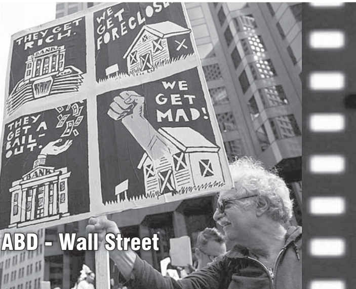
ABD - Wall Street

Parkın çevresini saran polis, kitleye biber gazı ve coplarla saldırdı. 68 göstericiyi gözaltına aldı. Küresel krizin