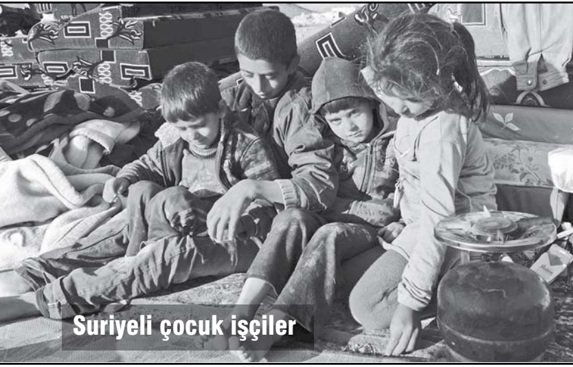
Suriyeli çocuk işçiler

saldırganlıklarıdır. Enerji yataklarını ele geçirmek ve kendi istediği doğrultuda bir Ortadoğu şekillendirmek isteyen ABD emperyalizmi, 2003'te başlattığı savaş ve işgalle Irak'ta korkunç bir yıkıma neden oldu. Yaklaşık 2 milyon insan savaş veya savaşın yol açtığı diğer nedenlerle öldü. Çok daha fazlası yaralanırken, yüz binlerce insan evini terk etmek zorunda kaldı. ABD işgalinden sonra Irak'ta egemenler iktidar kavgasına tutuştular ve bu kavgalarını mezhep kılıfıyla örtmeye çalıştılar. Şii egemenler, Sünni egemenleri iktidardan dışladılar ve bu kavga her gün patlatılan bombalarla ve onlarca insanın öldürülmesiyle sürüp gitti, gidiyor. Son birkaç aydır IŞİD denen örgütün devreye girmesiyle Irak'taki iç savaş çok daha yaygınlaşmış ve açık bir şekilde mezhepçi bir hal almıştır.