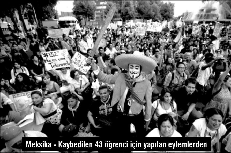
Meksika - Kaybedilen 43 öğrenci için yapılan eylemlerden

Peru'nun en büyük bakır madenlerinden Antamina'da çalışan işçiler, 10 Aralıkta ikramiye ve diğer sosyal haklarını korumak için iş bıraktılar. Aradan bir ay geçmeden ikinci grevin yaşandığı madende, süresiz olarak iş durduruldu. Peru'nun bakır üretiminin üçte biri 2013'te bu madende yapılırken, bu yıl üretim düştü. BHP Billiton, Glencore, Mitsubishi gibi büyük firmaların ortaklık yaptığı Antamina madeninde, ayrıca çinko, kurşun ve gümüş çıkarılıyor. Peru ihracat gelirinin %60'ı minerallerden elde ediliyor. Devletin grevi yasaklamasına rağmen işçiler, haklarını gasp ettirmemekte kararlılar.