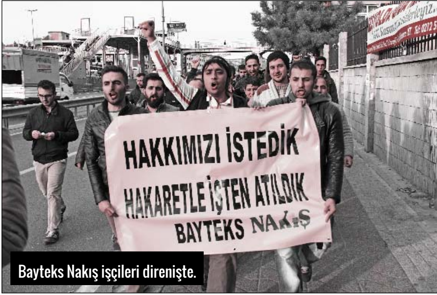
Bayteks Nakış işçileri direnişte.