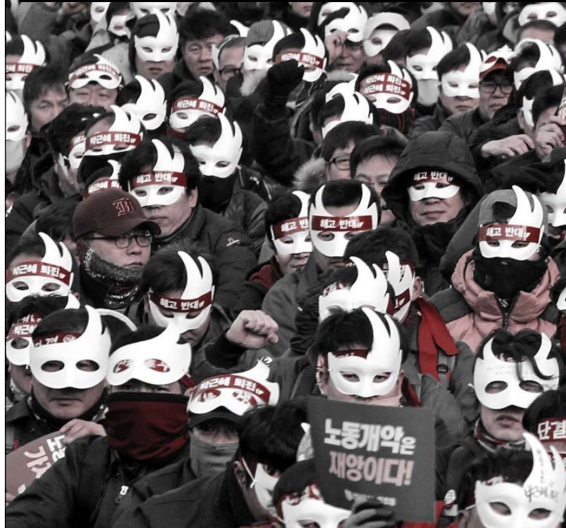
KCTU artan baskıları protesto etmek için 5 Aralıkta büyük bir miting

Yunanistan Başbakanı Çipras, kurtarma paketleri çerçevesinde yapılacak kesintileri sert bir şekilde protesto eden muhalefet için "it ürür kervan yürür" diyor. Seçimlerin yenilenmesinin ardından yeniden iktidar koltuğuna oturmasına güvenen Çipras, önceki dönemde sosyal reformlar ve AB ile ilişkiler konusunda verdiği sözleri bir kenara bırakarak, krizin faturasını Yunan işçilerinin sırtına yıkmaya girişti. Yunan işçi sınıfı da ülke genelinde hayatı