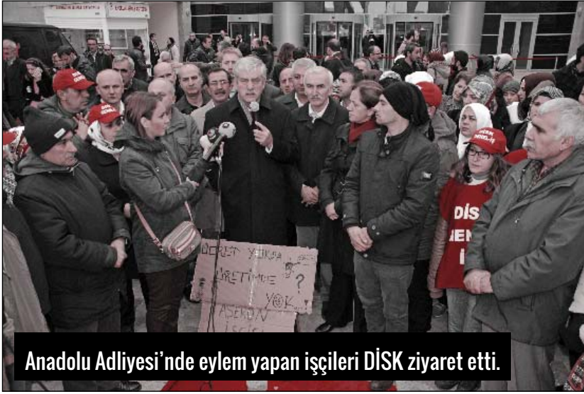
Anadolu Adliyesi'nde eylem yapan işçileri DİSK ziyaret etti.

Sendikasında örgütlü olan işçiler, eylemlerini Konak'taki İzmir Büyükşehir Belediyesi binası önünde, 10.00-17.00 saatleri arasında sürdürme kararı aldılar. İşçiler, ücretlerinin yüzde 26 oranında arttırılmasını ve ikramiyelerin 75 günden 120 güne çıkarılmasını talep ediyorlar. Kent Ekmekek yönetimi ise yüzde 8 ücret artışını dayatıyor. Yönetimin dayatmalarına karşı grevlerini sürdüren işçiler, sınıf örgütlerine dayanışma çağrısında bulunuyorlar.