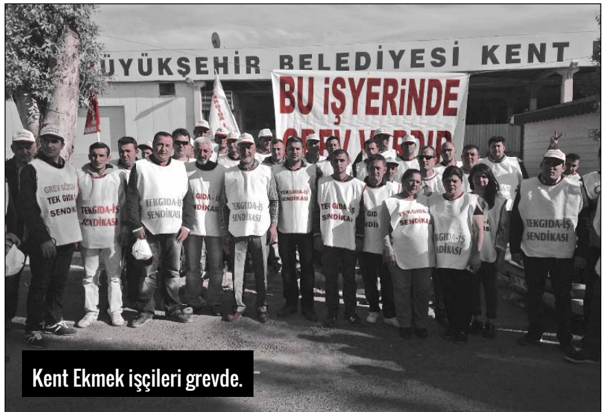
Kent Ekmek işçileri grevde.

30 Ekimden bu yana grevde olan Kent Ekmek işçileri, fabrika yönetimiyle yaptıkları görüşmelerden anlaşma çıkmaması üzerine greve devam kararı aldılar. Tek Gıda-İş