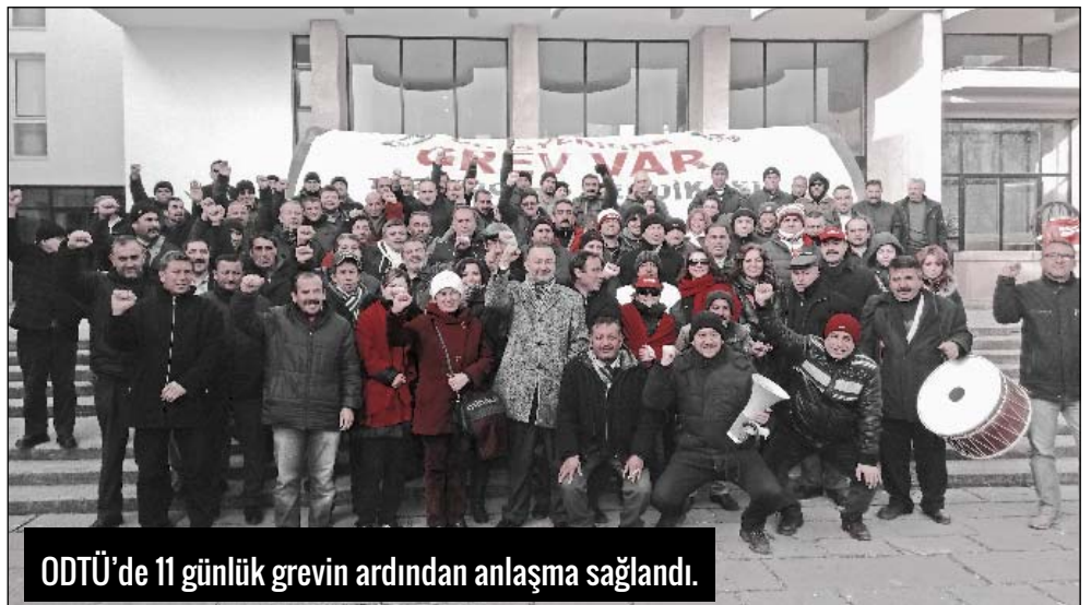
ODTÜ'de 11 günlük grevin ardından anlaşma sağlandı.