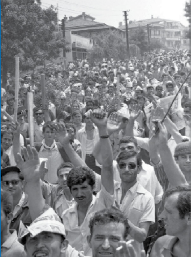
15-16 Haziran 1970 Büyük İşçi Direnişinden bir kare

Uluslararası İşçi Dayanışması Derneği (UİD-DER), kapitalist sömürüye karşı işçi sınıfının uluslararası mücadelesini savunan ve bu doğrultuda çalışan sosyalist bir işçi örgütüdür.