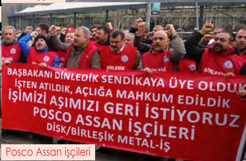
Posco Assan işçileri