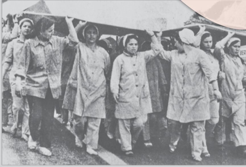
Gebzeli kadın işçiler İstanbul'a yürüyor