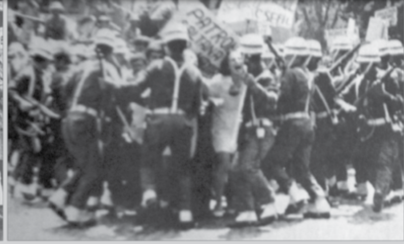
Kadın işçiler asker barikatını yarıyor