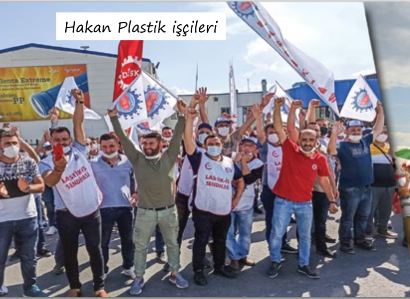
Hakan Plastik işçileri