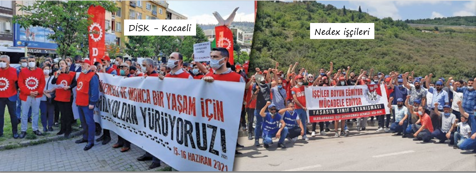
DİSK - Kocaeli