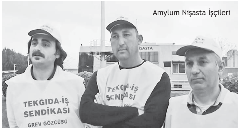
Amylum Nişasta İşçileri