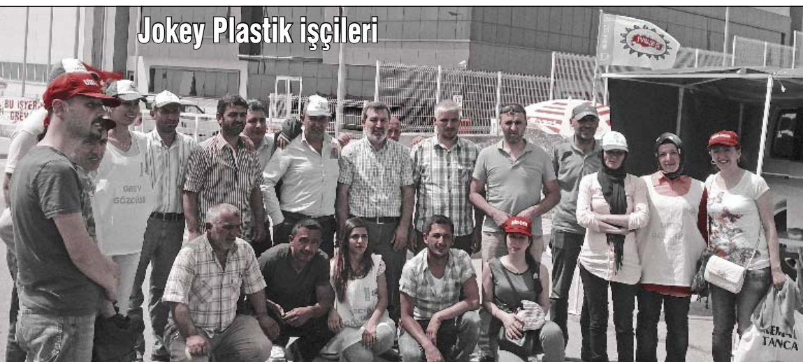
Jokey Plastik işçileri

Esenyurt, Kırac, Hadımköy ve Kâğıthane'de depoları bulunan Zet Farma'da işçilerin Nakliyat-İş'te örgütlenmesinin ardından 12 işçi işten çıkarılmıştı. İşten atmalara karşı geçtiğimiz yıl 3 Kasım'da direnişe geçen işçilerin mücadelesi devam ediyor. Direnişçi Zet Farma işçileri "İşten atılan işçiler, sendikalı bir şekilde işe geri alınana kadar mücadelemize devam edeceğiz" diyorlar. ■