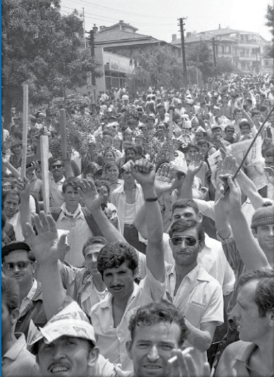
15-16 Haziran 1970 Büyük İşçi Direnişinden bir kare

UID-DER'in güçlü köklerini oluşturan sosyalistler ve mücadeleciler, 12 Eylül 1980 askeri faşist darbesine ve ardından gelen zorlu yıllara rağmen işçi sınıfının saflarında kapitalizme karşı mücadeleyi kesintisiz olarak sürdürdüler. Askeri darbenin ardından buzun kırılıp yolun açılmasına, işçi sınıfı hareketinin yeniden canlanmasına katkı sundular. Onların uzun yıllara dayanan emeklerinin bir ürünü olarak, 1990'ların ortasında İşçi Öz-Eğitim Grupları doğdu. Çeşitli sektörlerden, sendikalardan, grev ve direniş alanlarından gelen işçiler, İşçi Öz-Eğitim Grupları adı altında birleştiler.